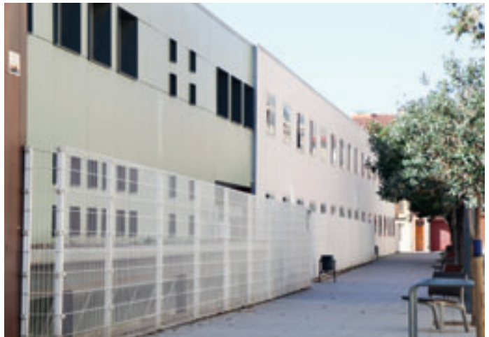
L'Associació de Veïns de l'Havana i Rodalies demana més serveis.