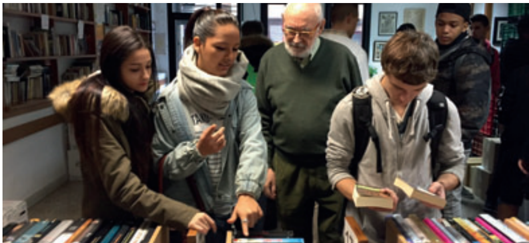
El públic de Llibre Viu és totalment heterogeni.