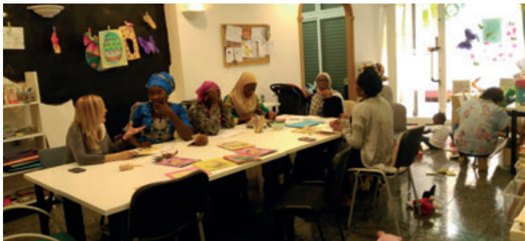
Projecte 360 graus de l'Espai João Martí.