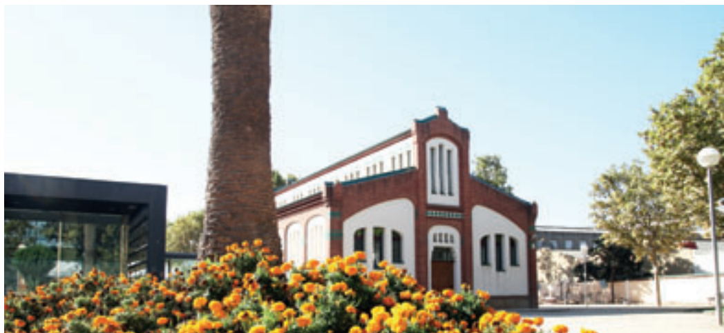
Jardins de l'antic escorxador.