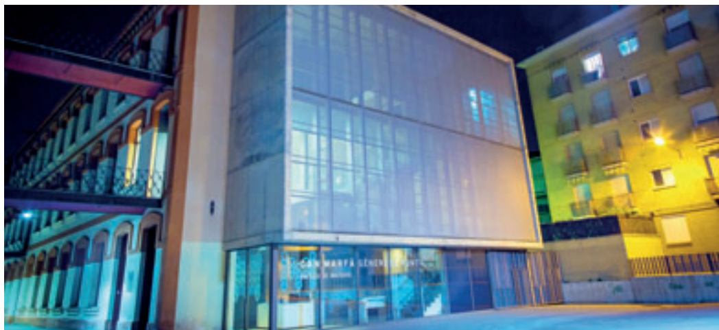
Can Marfà és un dels equipaments culturals més populars de Mataró.