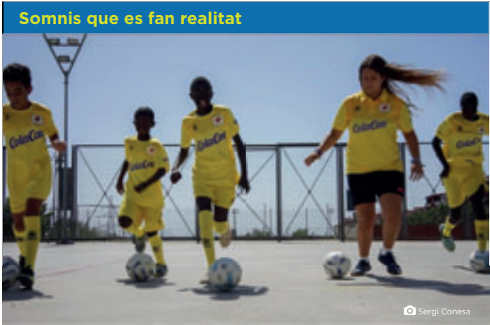
Somnis que es fan realitat

Les activitats que fem són un reforç educatiu i el projecte 360 graus, dedicat a les famílies, que els fem al local. I després la part esportiva la fem a l'espai que ens cedeixen el CEIP Rocafonda i l'escola Germanes Bertomeu. | Red.